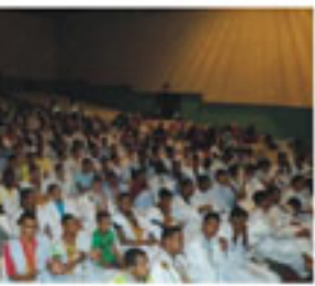
وايطوبه في تخليد العيد.

على وقع الحنجرة الشجية والصوت العذب وفي خلال دوحة الفن الرافعي لغنت الشبيبة بناء